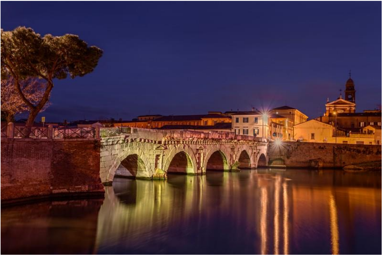
(Ponte di Augusto e Tiberio fatto iniziare da Cesare Augusto nel 20 a.C. e terminato con Tiberio nel 14 d.C.)