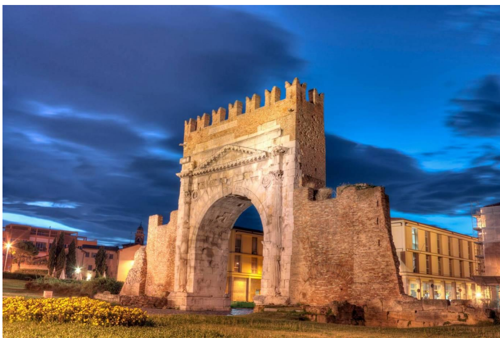
(Arco di Augusto - 27 a.C.)